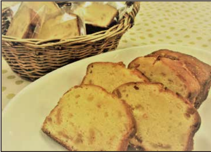
▲柚子のパウンドケーキは1個¥200で販売される。

1月23日、24日の二日間に渡り、限定柚子を使用したパウンドケーキ&自慢の焼き菓子販売！！